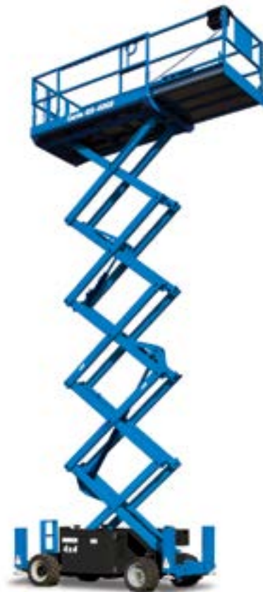
08/17 Деталь № В127284RU